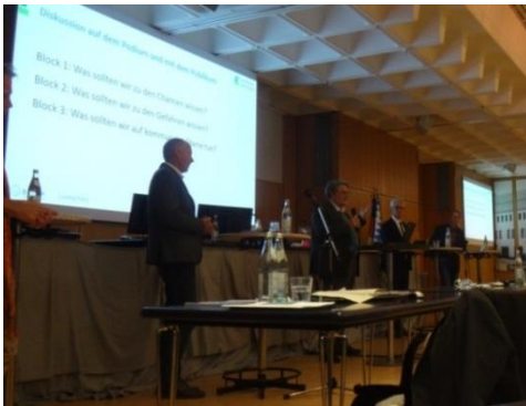
Abschlussfragen ans Podium: Noch mehr Chancen? Relevante Risiken? Vor allem die: Können die Kommunen etwas tun und wenn ja, was?